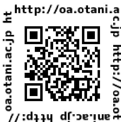
図 2. 認証ページ QR コード