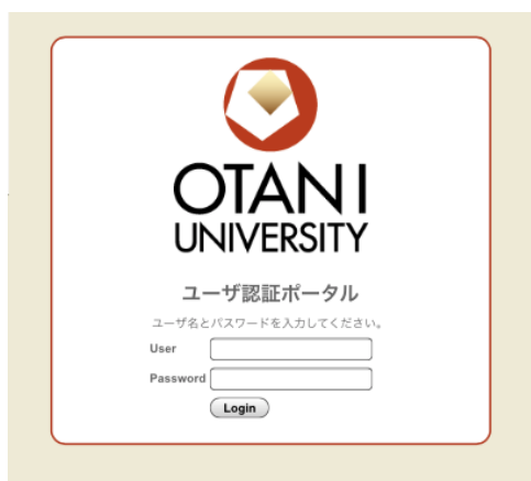
図 1. 認証ページ図